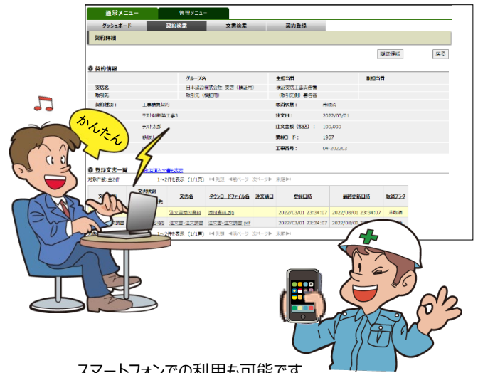
スマートフォンでの利用も可能です。