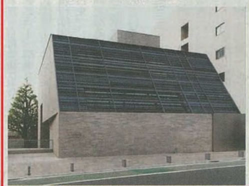
文京区立森鷗外記念館